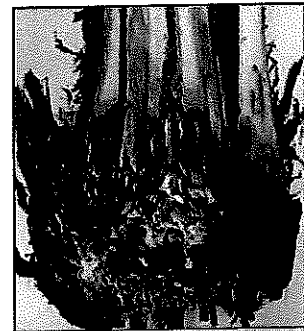
Bole at the base rotting (>100%) Batang di pangkal reput (>100%)