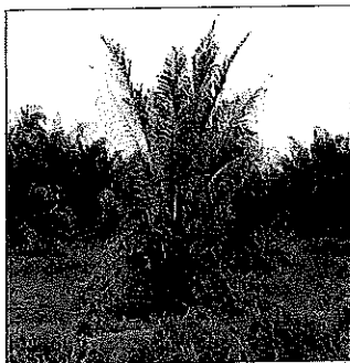
Very severe infection. Leaves completely wilted and dead with the bole at the base rotting (>30%) Jangkitan sangat teruk. Daun layu sepenuhnya dan mati dengan batang di pangkal reput