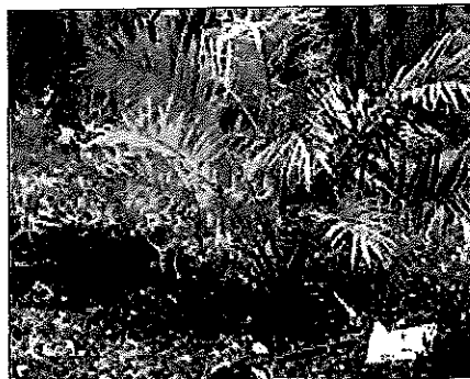
Severe infection. One-sided yellowing of leaves with rolling bole at the base Jangkitan teruk. Sebelah daun menguning dengan pangkal reput batang