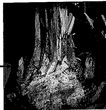
Mild infection. Old leaves turn pale green, some roots infected and slight rolling of the bole Jangkitan ringan. Daun tua menjadi hijau pucat, beberapa akar dijangkiti dan batang reput sedikit